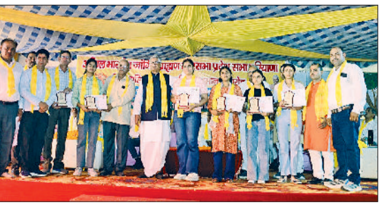
रेवाड़ी। कार्यक्रम में प्रतिभाओं का सम्मान करते अतिथि।

अखिल भारतीय जांगिड़ ब्राह्मण महासभा प्रादेशिक सभा हरियाणा के तत्वावधान में सोमवार को धारुहेड़ा के नंदरामपुर बास रोड स्थित वाटिका में जांगिड़ समाज के मेधावी व प्रतिभावान विद्यार्थियों के लिए सम्मान समारोह आयोजित किया गया। समारोह में पूरे प्रदेश के सरकारी कॉलेज में एमबीबीएस व आईआईटी में एडमिशन लेने वाले, 10वीं व 12वीं कक्षा में 90 प्रतिशत व इससे अधिक अंक पाने वाले तथा खेल जगत में राष्ट्रीय व अंतरराष्ट्रीय स्तर पर पदक लाकर समाज का नाम रोशन करने वाली करीब 135 प्रतिभाओं का सम्मान किया गया।