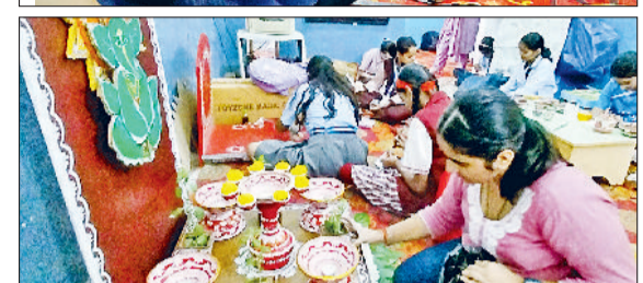
रेवाड़ी। श्रीराम जी का स्कैच बनाते हुए छात्रा, स्कैच बनाते प्रतिभागी, दीया डेकोरेशन करते हुए छात्रा।