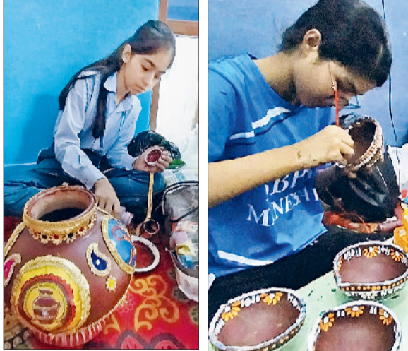
रेवाड़ी। कलश व दिया डेकोरेशन करते हुए छात्राएं।