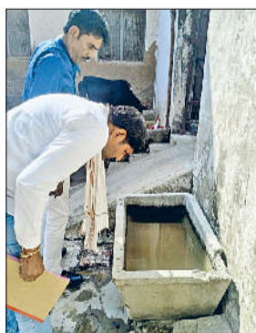
रेवाड़ी। पशु खेल में लावा की जांच करते हुए स्वास्थ्यकर्मी, पानी की टंकी में लावा की जांच करते हुए स्वास्थ्यकर्मी।