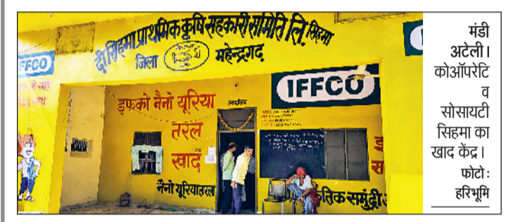
हरिभूमि न्यूज ▶▶ मंडी अटेली

जिले के खेतों में रबी की फसलों की बुवाई का समय चल रहा है, लेकिन पर्याप्त मात्रा में डीएपी खाद नहीं मिलने के कारण किसान फसलों की बुवाई का काम पूरा नहीं कर पा रहे हैं। खाद केंद्रों पर खाद लेने के लिए किसान चक्कर लगा रहे हैं। केंद्रों पर खाद का रैक अक्सर खाली रहता है।