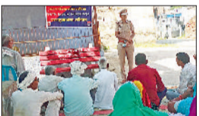
नारनौल। ग्रामीणों को नशे के खिलाफ जागरूक करते हुए।