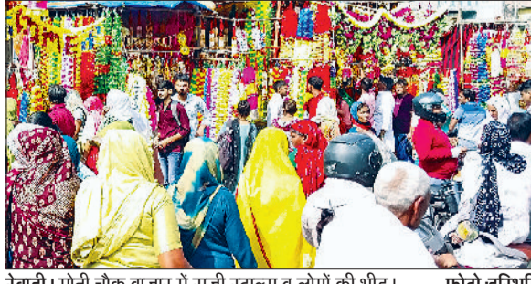
रेवाड़ी। मोती चौक बाजार में सजी स्टाल्स व लोगों की भीड़।

ज्योतिषाचार्य ने कहा कि आमदिनों में तो व्यक्ति प्रतिदिन सुबह बिस्तर त्याग देता है, लेकिन काफी व्यक्ति ऐसे हैं, जो सुबह देर तक उठते हैं। ऐसा करने से घर में दरिद्रता का आगमन होता है और व्यक्ति के स्वास्थ्य पर भी विपरीत असर होता है। शास्त्रों के अनुसार दीपावली के