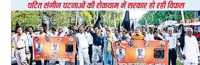
घटित संगीन घटनाओं की रोकथाम में सरकार हो रही विफल