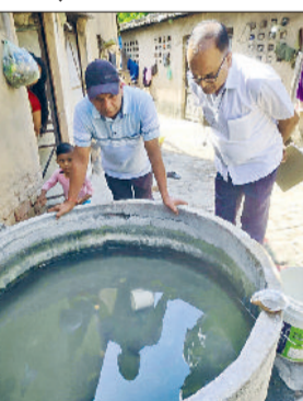
रेवाड़ी। लावा मिलने पर महिला को नोटिस देते हुए।